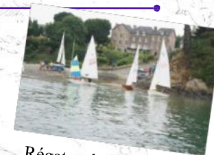
Régates dans la Baie et événements nautiques