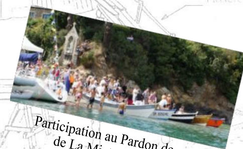
Participation au Pardon de La Miette, 15 Août.