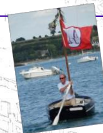
Championnat de Rance de Godille