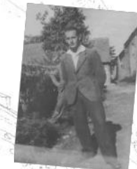
6 Août 1944, Traversée de la Rance à la nage. Trophée Jules Camp