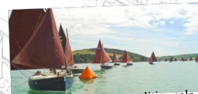
Accueil de bateaux traditionnels