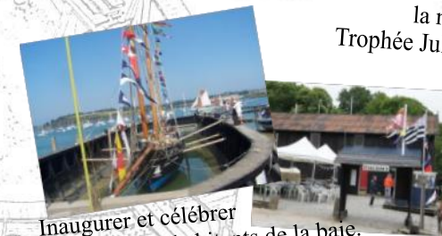
Inaugurer et célébrer aux côtés des habitants de la baie.